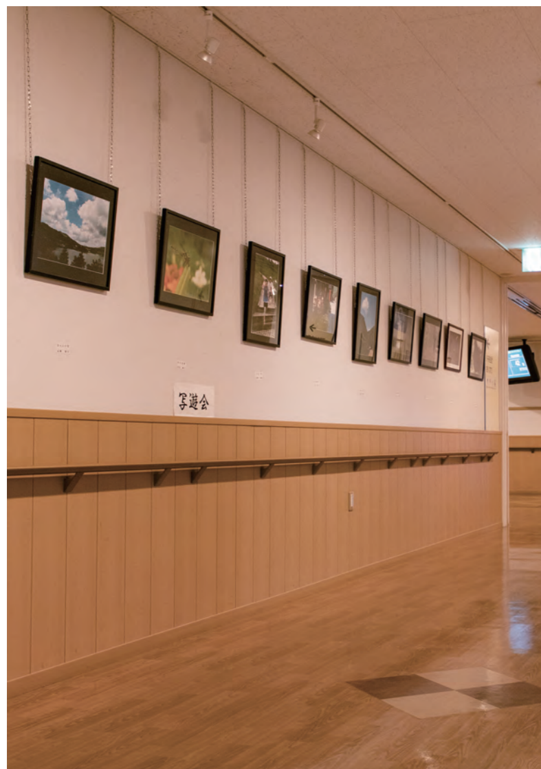
外来の廊下に飾られた写真会による写真展示。 来院された方に楽しんでいただこうと、写真の入れ替えが年に数回行われる。

当院の外来は、看護師20名、ナースングアシスタント（看護補助者）11名、歯科衛生士2名、歯科助手1名で業務を行っています。