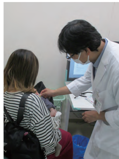
小児科のワクチン接種の様子。