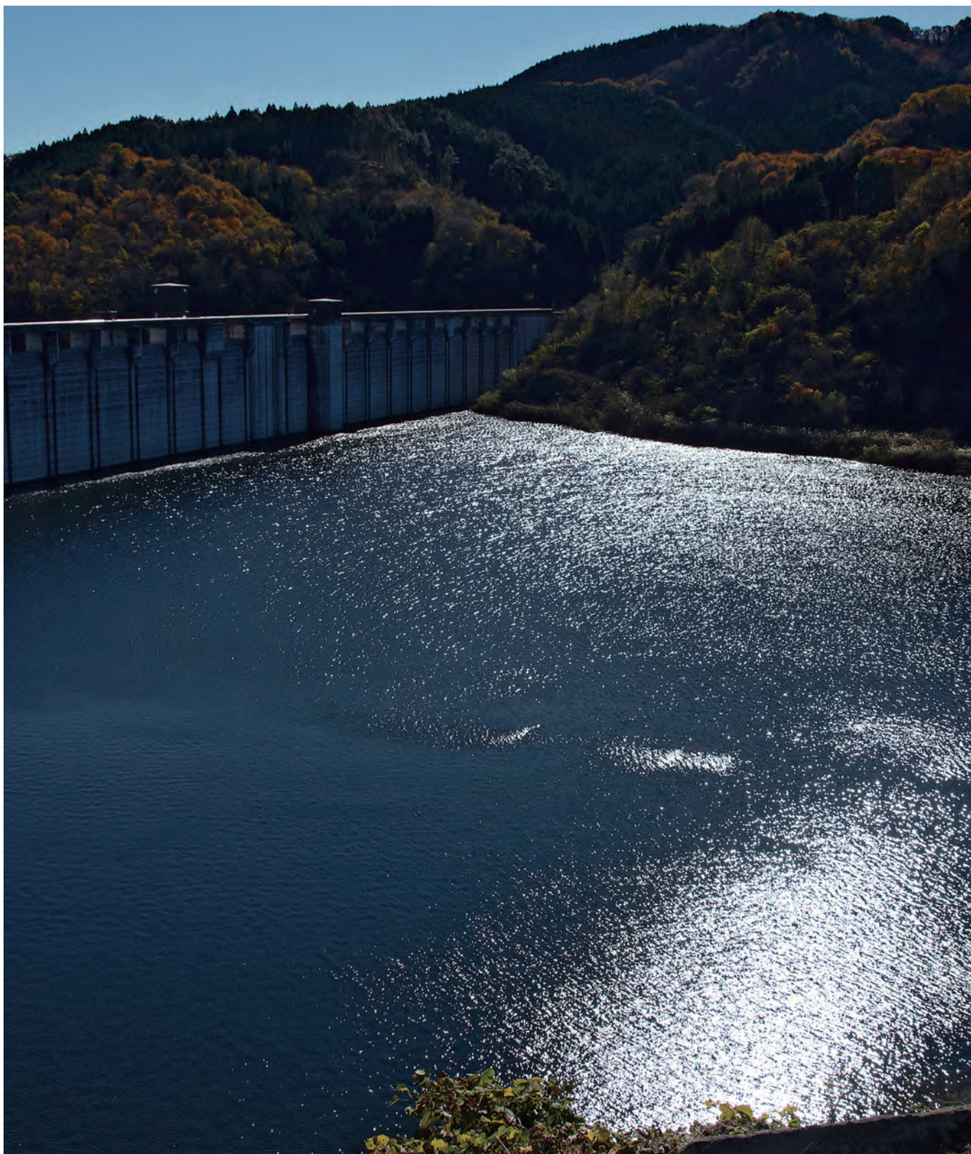
撮影地：高萩市 タイトル：「小山ダム秋景色」

看護師新人研修について、コラム、外来のはなし、医事課のはなし ニュース、新任医師紹介