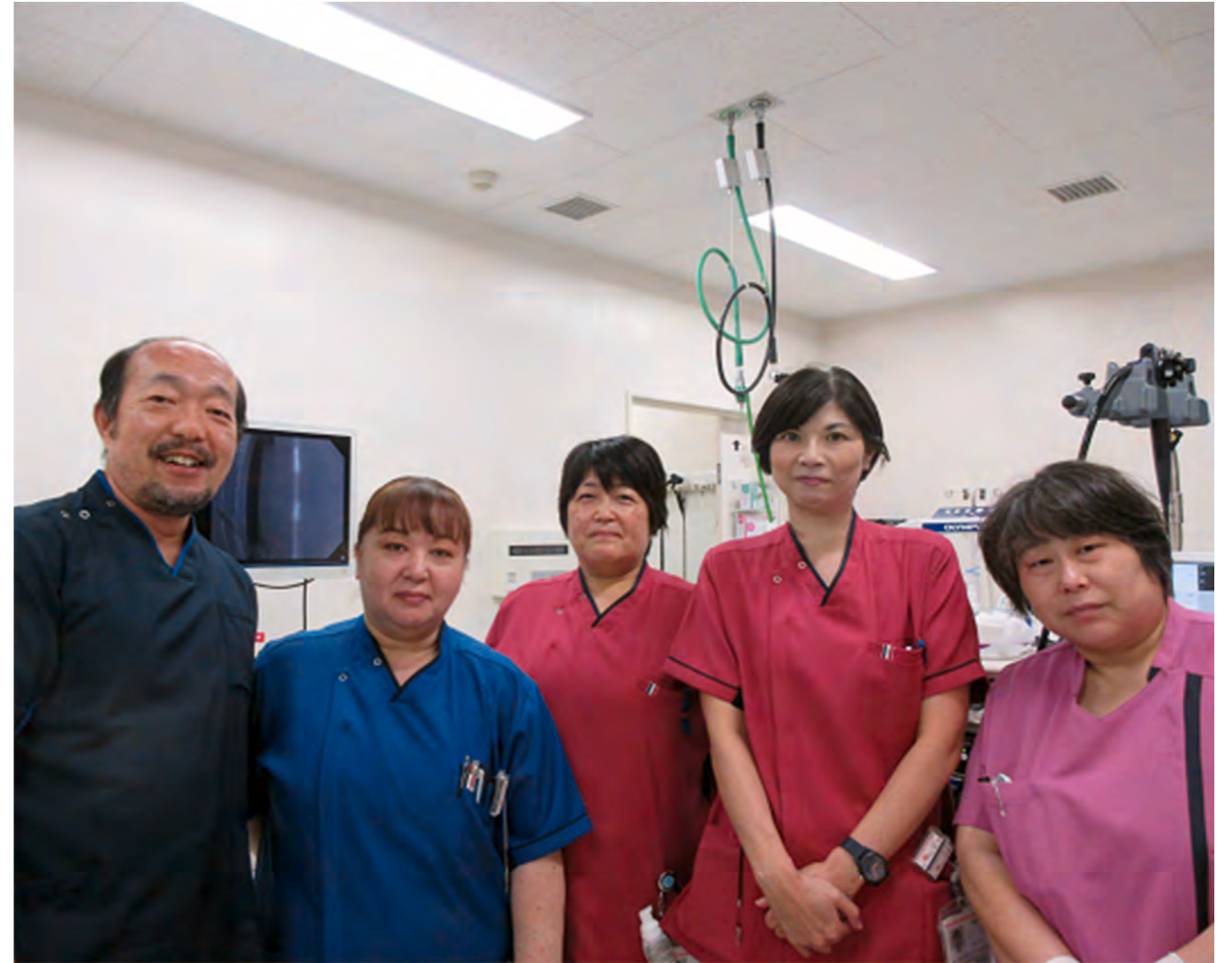
内視鏡室スタッフ

す。以前に内視鏡検査を行った時に、痛みが強かったり辛い思いをされた方は鎮静剤を使用して検査を受けることもできます。ただし車の運転の制限などがありますので予約の際には確認をお願いします。 また、検査による感染を起こすことが無いように使用したカメラは手洗い洗浄を行った後に専用の洗浄機を使用して洗浄、消毒を行っています。 来院時に内視鏡検査のことで聞きたいことなどがあれば遠慮なく声をかけてください。