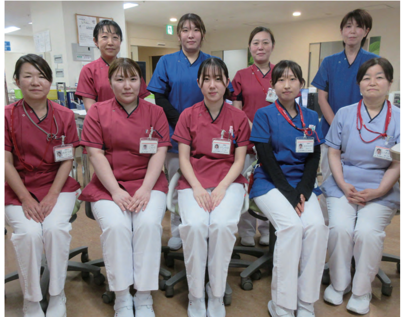
3階東病棟スタッフ

活にも目を向けて看護をさせていただいています。また、病棟看護師だけでなく、医師やリハビリスタッフ、医療ソーシャルワーカー、訪問看護師とも協働し、退院先はどこが適切か、ご自宅への退院に向けてどんな看護が必要かを週に1回退院調整カンファレンスで話合っています。「退院後も定期的に看護を受けたい。」という患者様には当院訪問看護ステーションへの紹介も行っていますので、お気軽にご相談ください。 これからは患者様への思いやりと寄り添う気持ちを持って、希望される退院先へ行けるよう支援させていただきますので、よろしくお願いたします。