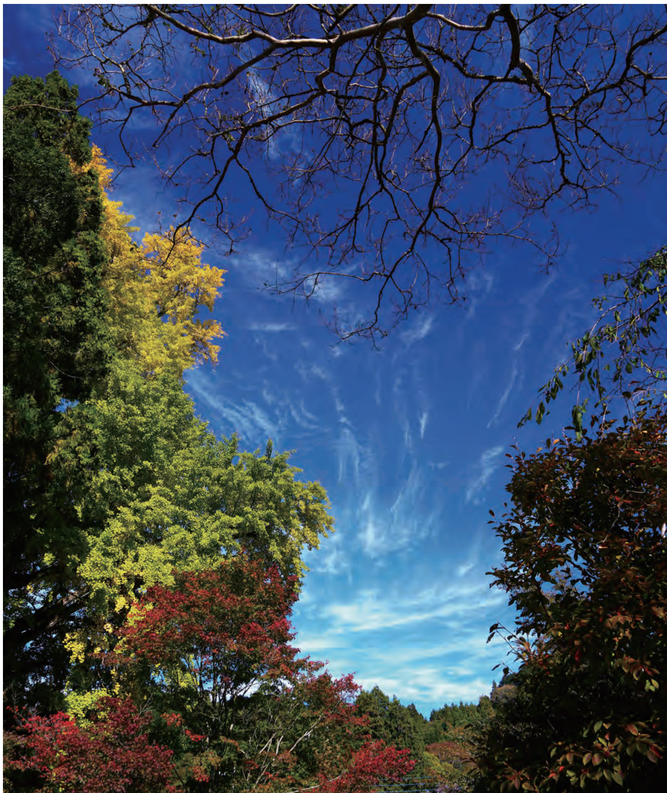
撮影地：茨城県大子町 タイトル：「秋空」

ニュース、医療にまつわるちょっといい話（薬剤部）、3階東病棟のはなし、内視鏡室のはなし、医療にまつわるちょっといい話（臨床検査部）